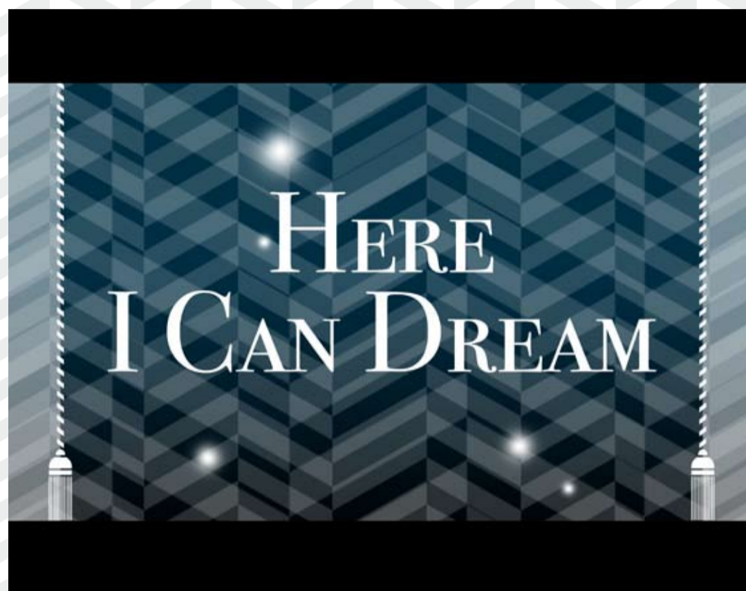
IMMAGINE ITALIA & Co. RACCONTI DI VIAGGIO IMMAGINE ITALIA & Co. TRAVEL NOTES

5/8 FEBBRAIO 2010 FIRENZE FORTEZZA DA BASSO