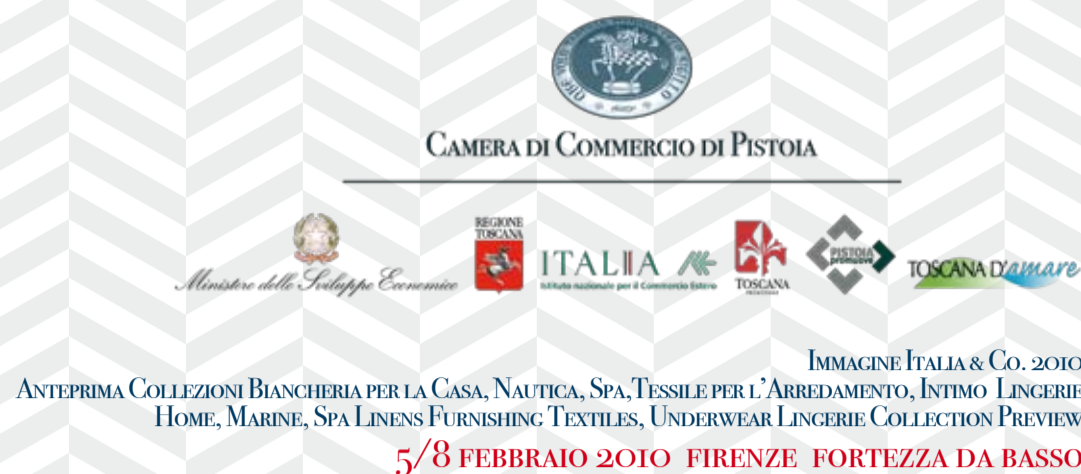
IMMAGINE ITALIA & Co. 2010 ANTEPRIMA COLLEZIONI BIANCHERIA PER LA CASA, NAUTICA, SPA, TESSILE PER L'ARREDAMENTO, INTIMO LINGERIE HOME, MARINE, SPA LINENS FURNISHING TEXTILES, UNDERWEAR LINGERIE COLLECTION PREVIEW

5/8 FEBBRAIO 2010 FIRENZE FORTEZZA DA BASSO